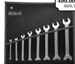
8-dílná sada klíčů DIN 3110 ve vinylovém pouzdře (4x5 - 18x19mm)

Sada vrtáků 19-dílná 1,00-10,00x0,5mm S338RCZ001HSSAX TIALN