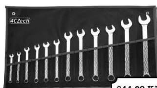
12-dílná sada klíčů DIN 3113 ve vinylovém pouzdře (7 - 24mm)

Výprodej starších typů Narex, Bosch, Makita, Protool a dalších sleva až 50% Více informací na prodejně.