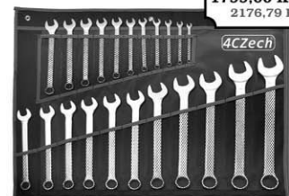
22-dílná sada klíčů DIN 3113 ve vinylovém pouzdře (6 - 32mm)