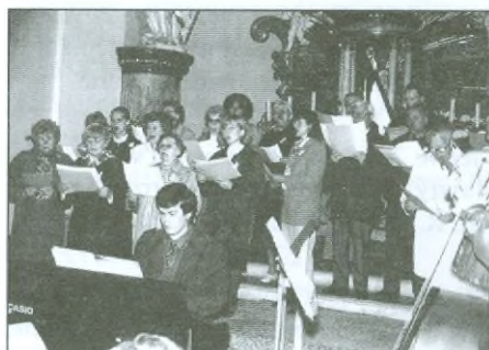
Rychnov n. Kn.