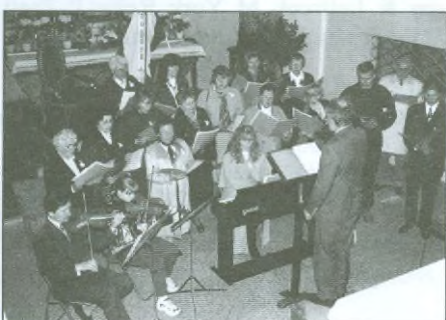
Kostelec n. Orl.

JEMA INŽENÝRSKÉ STAVBY, s. r. o., středisko Pohoří čp. 3 u Dobrušky přijme 4 pracovníky