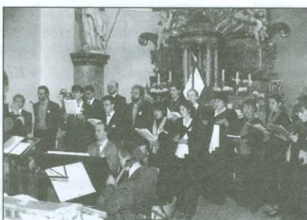
Nové Město n. Met.