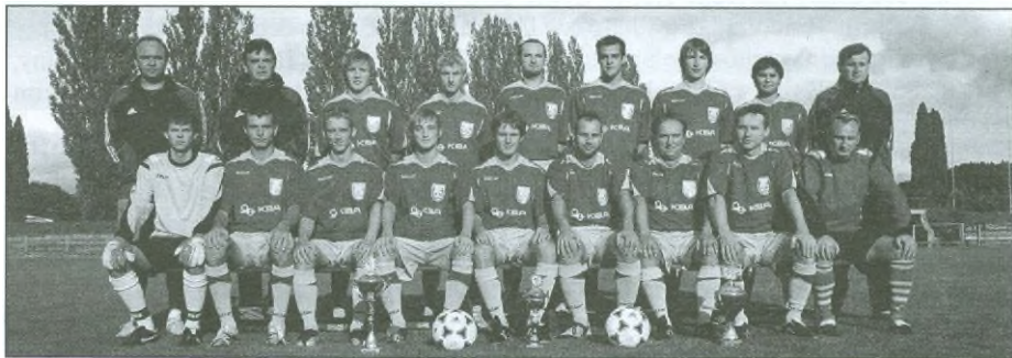
Foto: TJ Dobruška - vítěz krajské I. B třídy 2007/2008