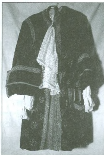
Kroj regenta Lhotského z filmu Temno