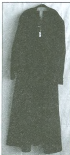
Kroj Koniáše ve filmu Temno oblékal Martin Růžek