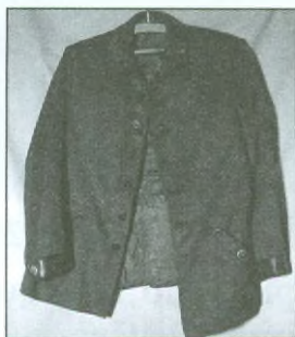
Kroj myslivce Machovce z filmu Temno

Je to svět sám pro sebe. Svět iluzí a nádherných klamů, svět někdy až neskutečných příběhů, které již po více než stovku let lákají a baví, vyvolávají úsměv nebo slzy na lících dalších a dalších generací. Svět filmu, svět pozoruhodných pohyblivých obrázků, který každý den přitahuje před filmová plátna (a dnes již také před obrazovky televizorů) stovky miliónů diváků.