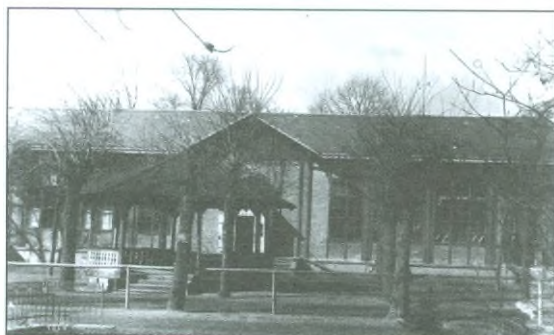
50. léta minulého století