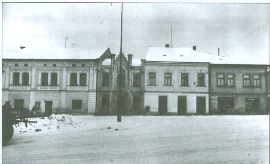
Domy bývalého Židovského města - 70. léta 20. století.