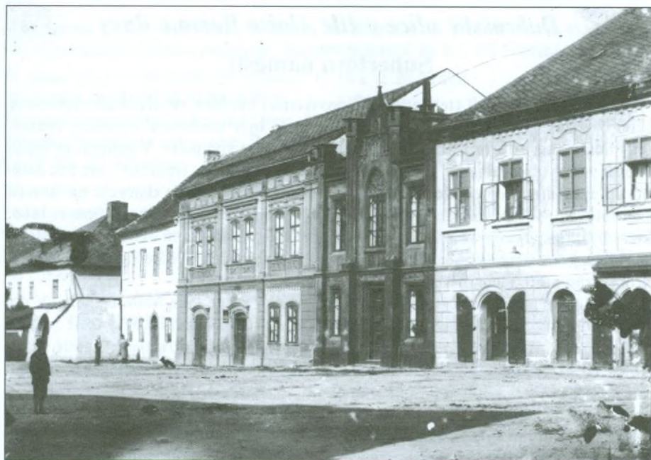
Domy Židovského města kolem roku 1900.