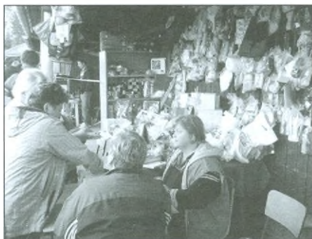
Tradiční bohatá tombola, která se letos vyšplhala k číslu 375 cen. Děkujeme všem sponzorům.