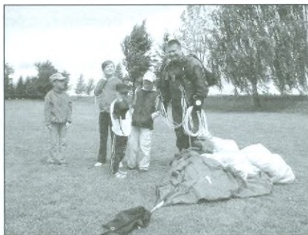
Zpestřením turnaje byl seskok parašutisty, který se dokázal vypořádat se silným větrem a přistát do středového kruhu, za což sklídl velký aplaus.

I když nám dopoledne počasí příliš nepřálo, jednatřicátý ročník fotbalového turnaje se vydařil jak po sportovní, tak po společenské stránce. Jedinou kaňkou na jinak zdařilém průběhu tradičního klání byla neúčast přihlášeného týmu Malšovic, který se bez omluvy nedostavil.