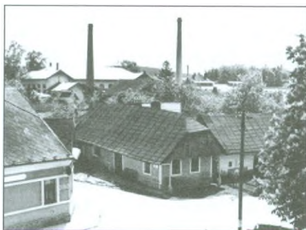
30. léta minulého století