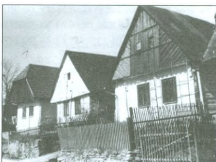
Polovina minulého století