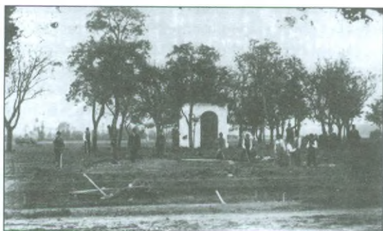
Konec 19. století