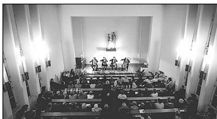
Koncert 19. října 2014