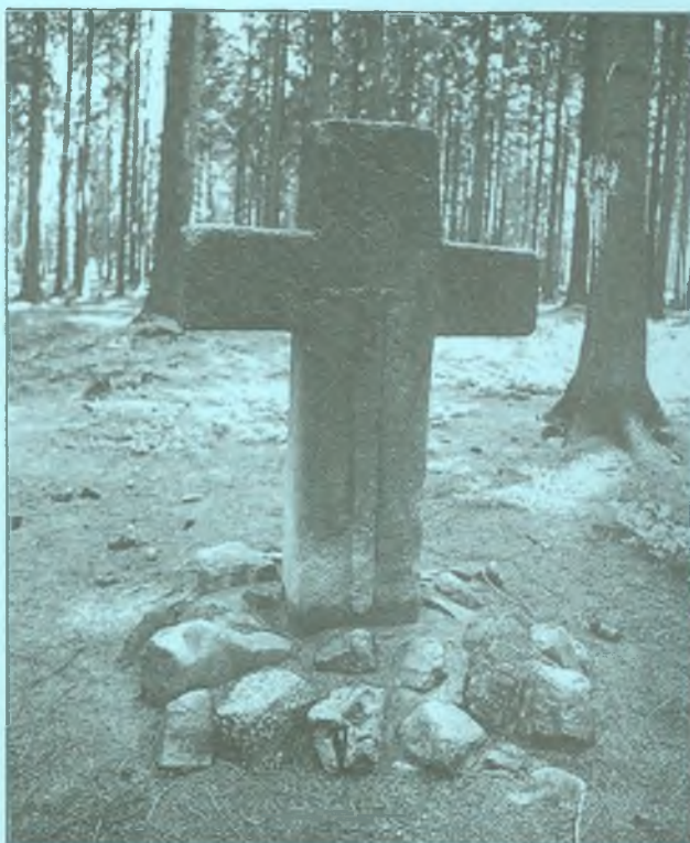
Smírčí kříž na místě, kde údajně došlo k osudovému souboji.

Více informací o soutěži najdete uvnitř čísla.