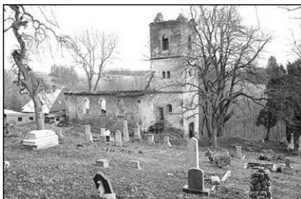
Zbytek z evangelického kostela v Rudníku