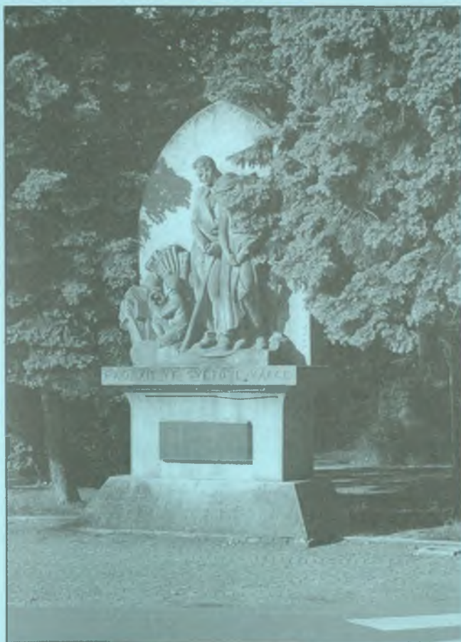
Pomník padlým v Dobrušce