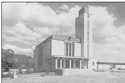
Husův sbor v Dobrušce, historická fotografie