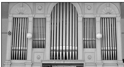
Varhany v Husově sboru v Dobrušce