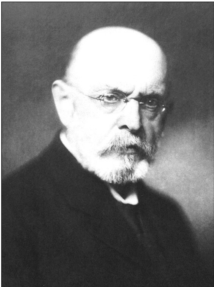
Portrét Aloise Jiráska