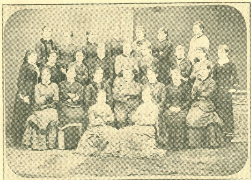
„VLASTA“ v r. 1881