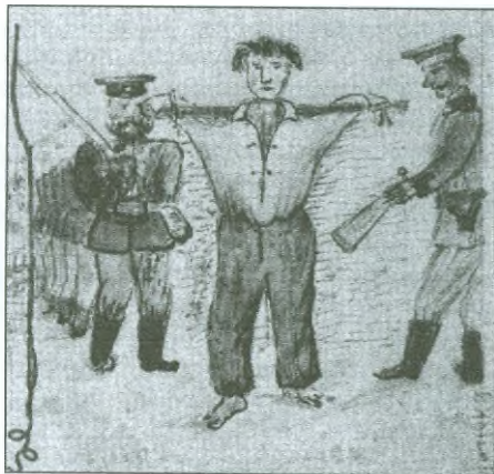
Alois Beer: Prusové odvádějí zajaté vesničany do Kladska.

Dnes jsou němými svědky těchto dávných událostí nejen dochované soudobé zbraně ve sbírkách městského muzea. O očitéch svědectvích přímo z bojiště