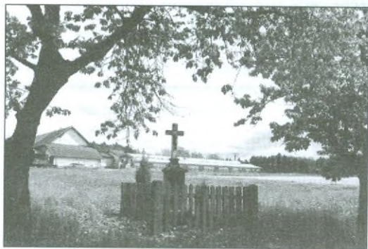
Současná podoba Řehákova kříže a jeho svěcení v roce 1956.