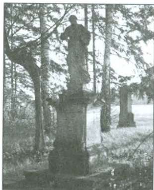
Socha sv. J. Nepomuckého.