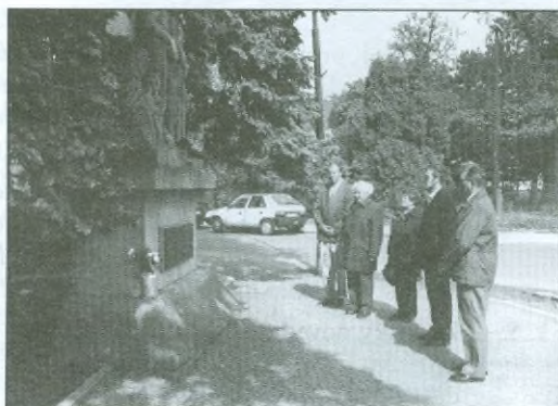
Zahájení pietního aktu u SPŠE v Dobrušce a položení kytice u pomníku v Archlebových sadech 7. května 1999.