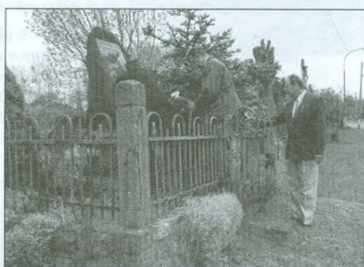
Položení kytic u pomníku padlých v Pulicích a v Domašíně.