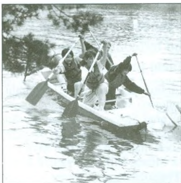
Loď mladších zákyň při slalomu.