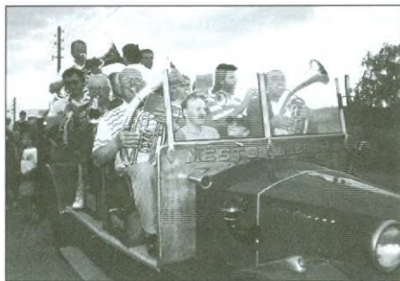
Dechová hudba Mělčaňanka 30. 4. 2000.