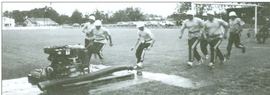
Družstvo mužů při soutěži o Dobrušský pohár 2. 9. 2000.