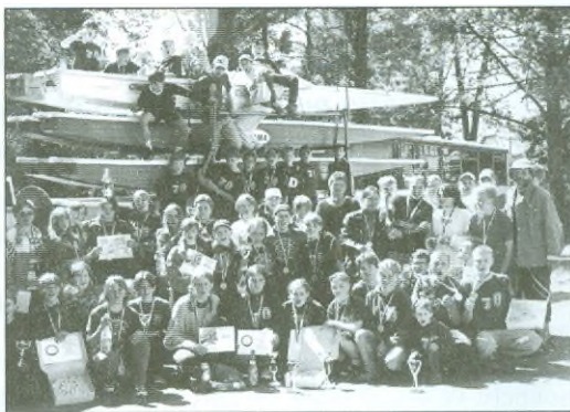
Naši vodáci po vyhlášení výsledků MČR v Ml. Boleslavi.