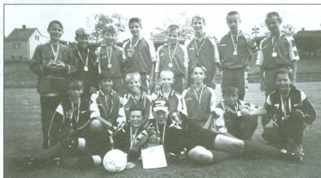
Mladší žáci fotbalového oddílu TJ Dobruška po převzetí vítězných trofejí na turnaji v Chocni.