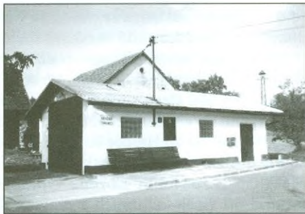
Hasičská zbrojnice v Mělčanech.