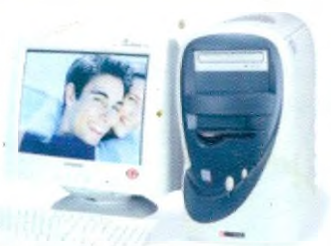
Počítač COMFOR Diablo + monitor 17"

Víte, že s počítačem si můžete nejen hrát ... ale i stříhat video nebo vyrábět fotky?