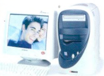
Počítač COMFOR Diablo + monitor 17"

Víte, že s počítačem si můžete nejen hrát ... ale i stříhat video nebo vyrábět fotky?