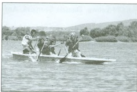
Mistři ČR a mezinárodní mistři ve vodáckém víceboji na pramici v kategorii žáků při sprintu na MM v Bratislavě.