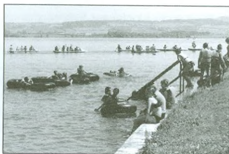
Dětský den „Sportujeme s Bodlinkou“ 3. června na Rozkoši.