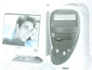
Počítač COMFOR Diablo + monitor 17"

Víte, že s počítačem si můžete nejen hrát ... ale i stříhat video nebo vyrábět fotky?