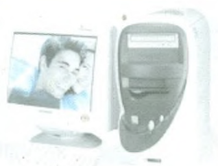
Počítač COMFOR Diablo + monitor 17"

Víte, že s počítačem si můžete nejen hrát ... ale i stříhat video nebo vyrábět fotky?