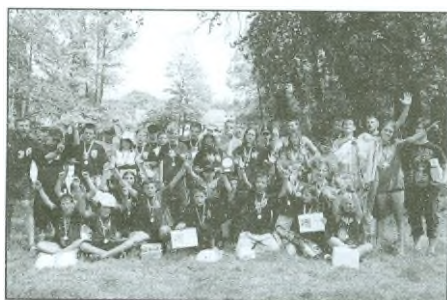
Naši vodáci po vyhlášení výsledků mistrovství ČR na Berounce.