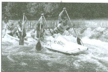
Mistři ČR a mezinárodní mistři ve vodáckém víceboji na pramici v kategorii kadetek na Orlici při sjezdu.