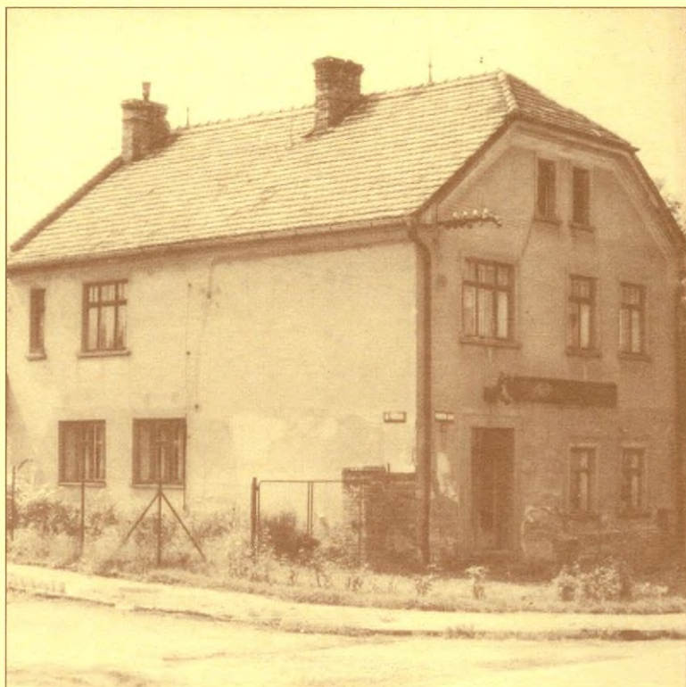
Hostinec Na Nově, kde vinný hrozeň původně visel.