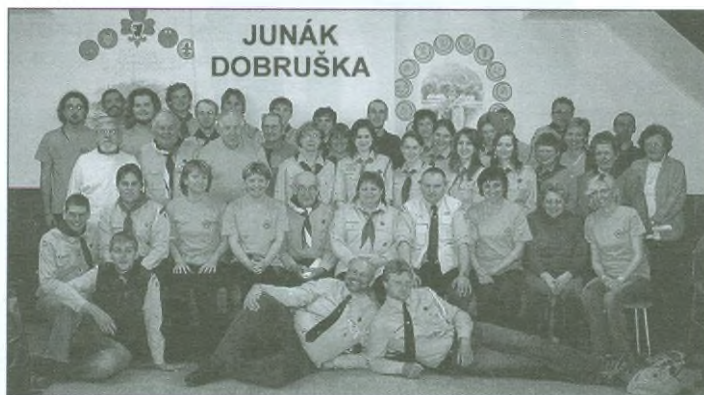
Účastníci výročního sněmu 16. 2. 2008 zdraví všechny chybějící činovníky a členy, rodiče dětí a přátele!