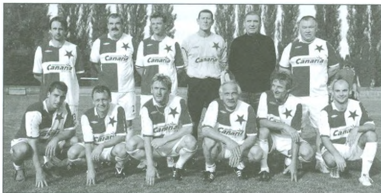
Slavia Praha – jedenáctka internacionálů

Sportovní odpoledne na dobušském stadionu, při němž si děti užily veselé chvíle na skákacím hradu a střelení na terč z paintbalové pušky, završila taneční zábava s pražskou hudební skupinou Sklezóza. Před půlnocí se nad hlavami bavicích se lidí rozsvítil ohňostroj.