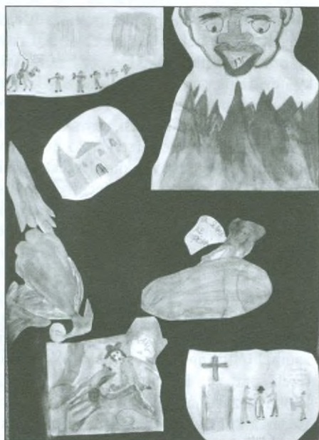
Koláž - komiks vytvořily žákyně 6. ročníku: Chmelíková, Pávová

Ilustrace jsou pracemi žáků ze Základní školy v Pulické ulici v Dobrušce.