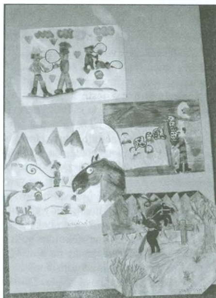
Koláž - komiks vytvořily žákyně 6. ročníku: Hajdúchová, Koláčná, Lukešová