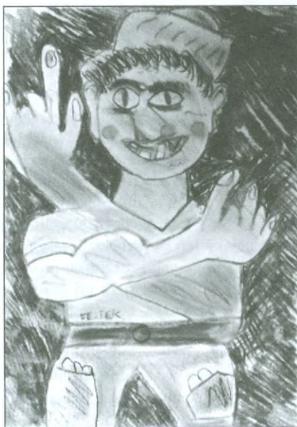
Tomáš Fejtek 7. třída