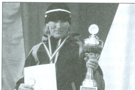
Trunečková Jana (58), mistryně světa ve všech disciplínách