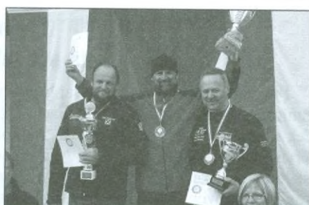
Flegl Bohumil (60), mistr světa ve slalomu, OS a komb. a 2. v S-G