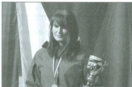
Preclíková Stanislava (93), mistryně světa ve slalomu, OS a komb. a 2. v S-G