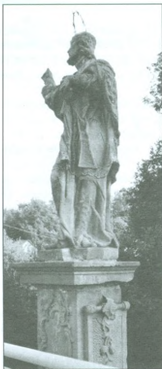
Původní originální socha na mostě v Cháborách