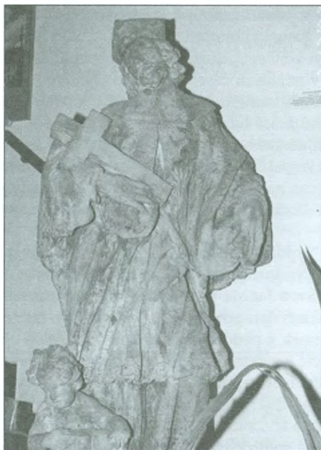
Originální socha uložená v lapidáriu městského úřadu.