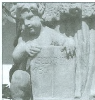
Detaily sochy stojící před domkem F. L. Věka.