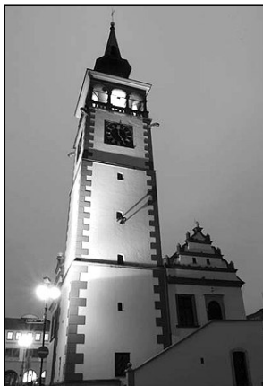
Na dobrušské radnici se udály důležité věci spojené s touto událostí.