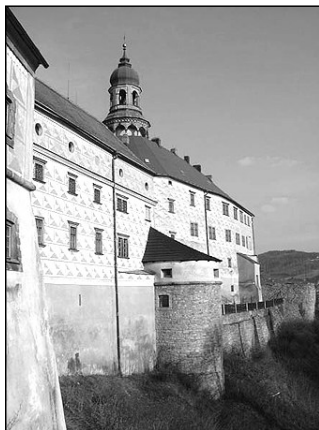
Jedním z míst, o něž se v hledaném roce bojovalo, byl také náchodský zámek.