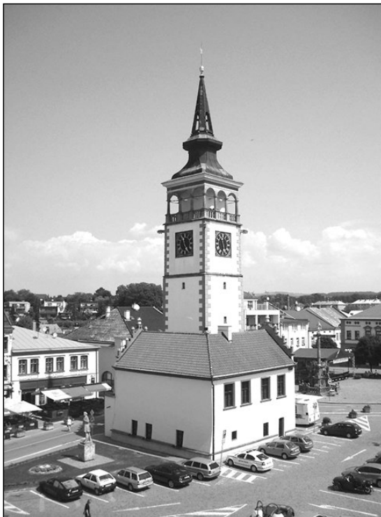
Radnice v současnosti