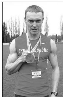
Bronz z ME je doma