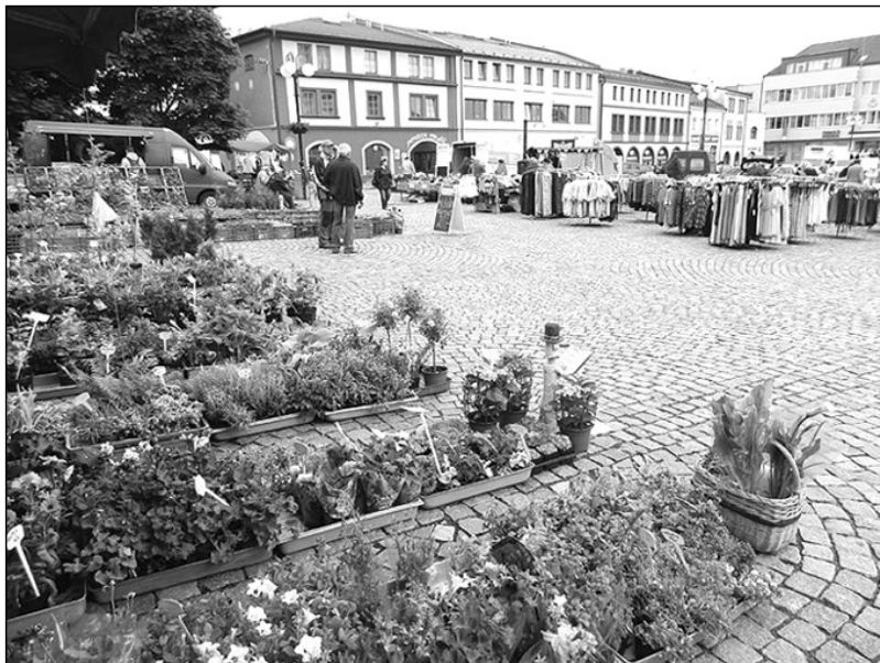
Trhy na náměstí F. L. Věka