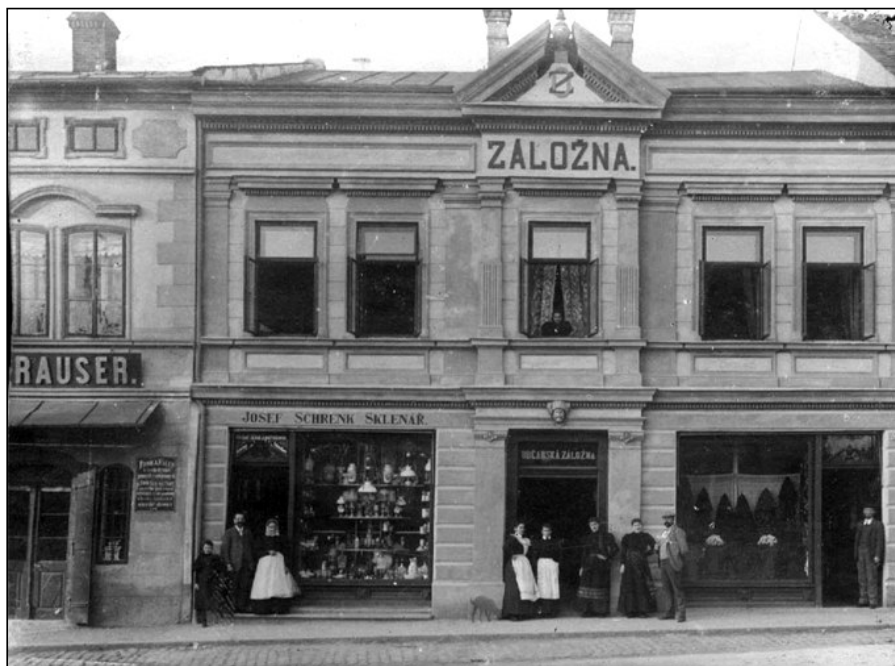
Čp. 11 na náměstí F. L. Věka