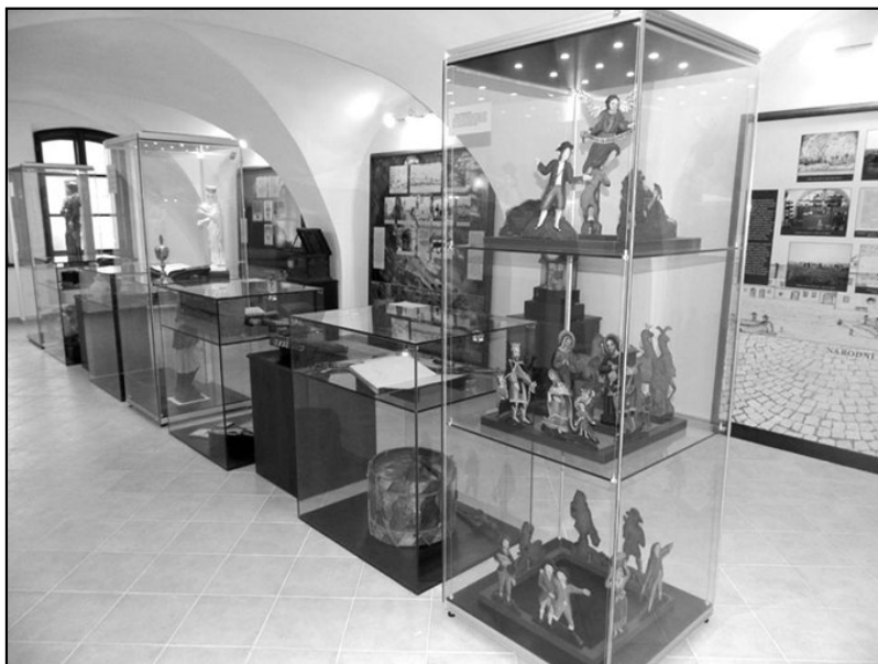
Nové historické expozice muzea