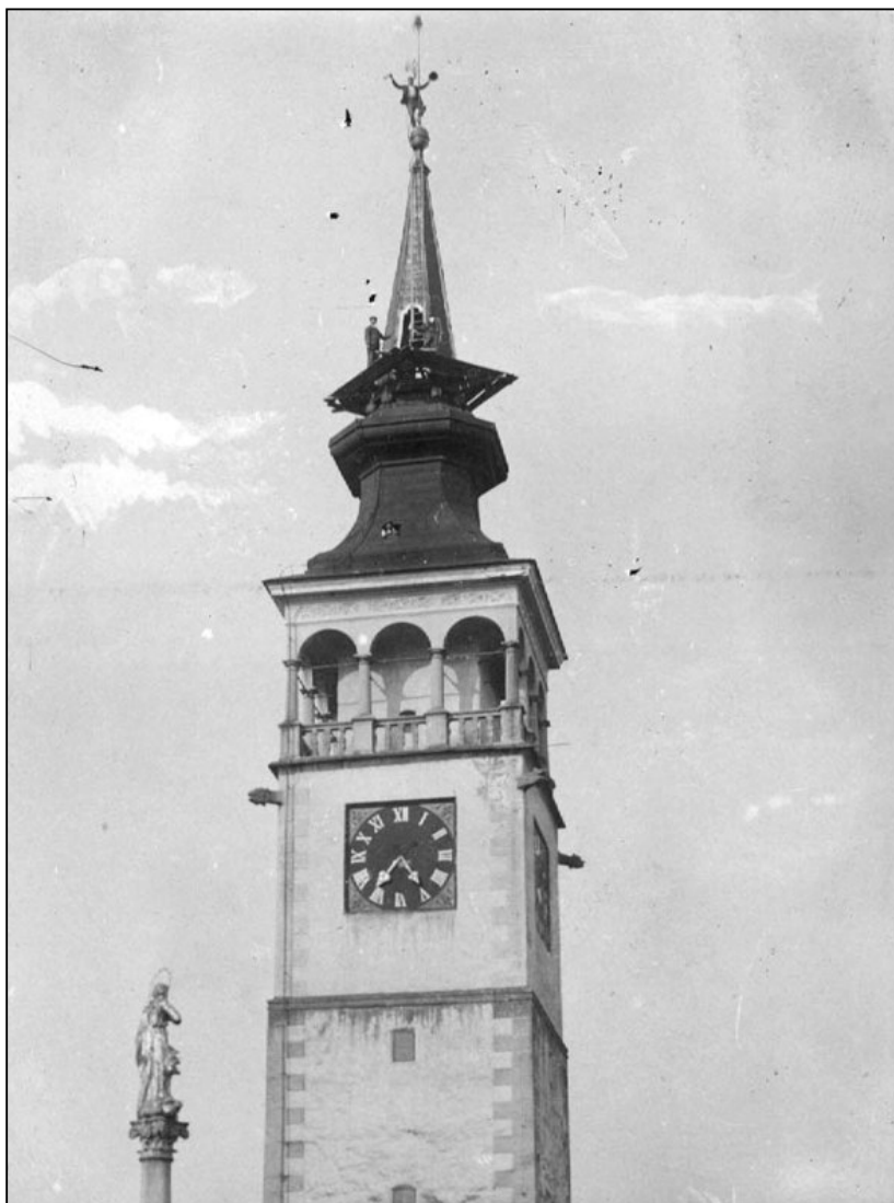
Radnice na počátku 20. století