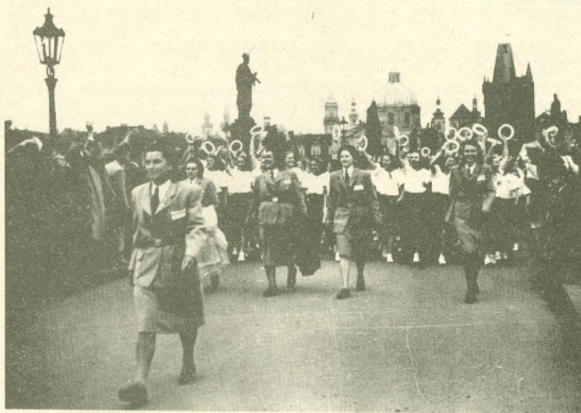
XI. všesokolský slet v Praze - v průvodu dobrušské dorostenky

Jistě i na XII. sletu nebudou chybět cvičenci s domovenkou "Dobruška", aby splnili heslo - "slet porozumění" pro sblížení všech, jimž se pravidelné cvičení stalo nezbytným, jako je nezbytný pozitivní vztah moderního člověka k tělovýchově a sportu.